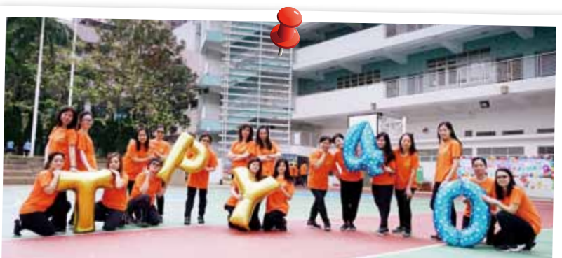
院屬董伯英幼稚園/幼兒中心教學團隊上下一心