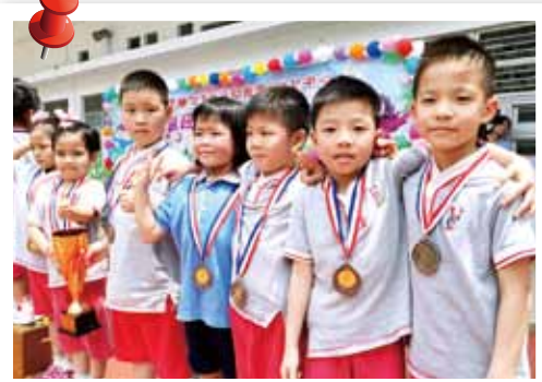
院屬裘錦秋幼稚園/幼兒中心健兒勝不驕，敗不餒