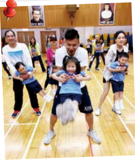
爸爸媽媽站起來，舞動幼兒，享受天倫之樂