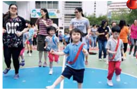
1、2、3，齊做熱身，準備競賽