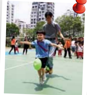
最佳拍檔，戰無不勝