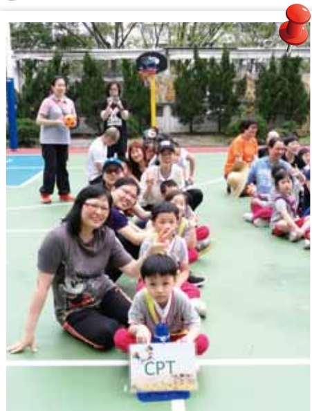
院屬蔡百泰幼稚園/幼兒中心親子參與聯校競賽