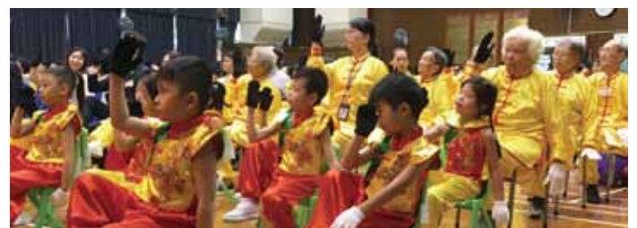
看！幼兒與長者認真投入耍坐式太極，場面和諧