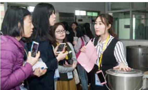
仁濟教學團隊參觀陳村精博實驗幼兒園的廚房，從而認識當地校園安全制度及管理