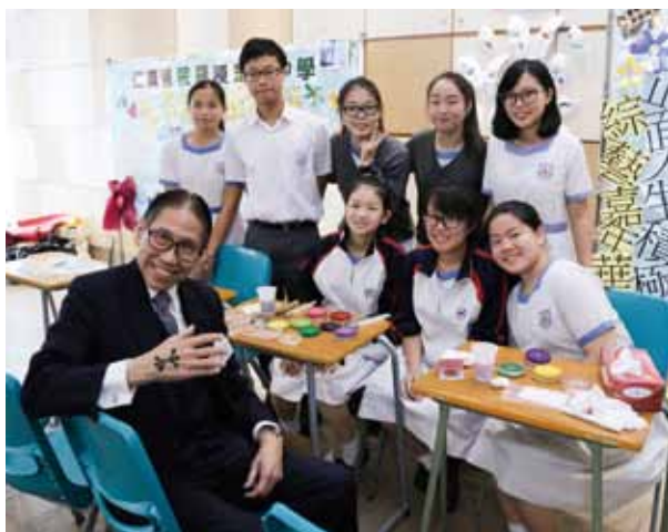
主禮嘉賓梁智鴻醫生參觀仁濟屬校攤位，親試彩繪，並與學生拍照留念

仁濟醫院董事局一向致力推動品德教育。自2015年開始於6間院屬中學推展「跨代共融義工服務計劃」，鼓勵屬校學生關心社區有需要人士，積極參與義工服務，培養良好公民責任。為了延續計劃成效，仁濟於2017年5月15日假院屬林百欣中學舉行「跨代共融義工服務計劃」聯校展覽暨分享會。