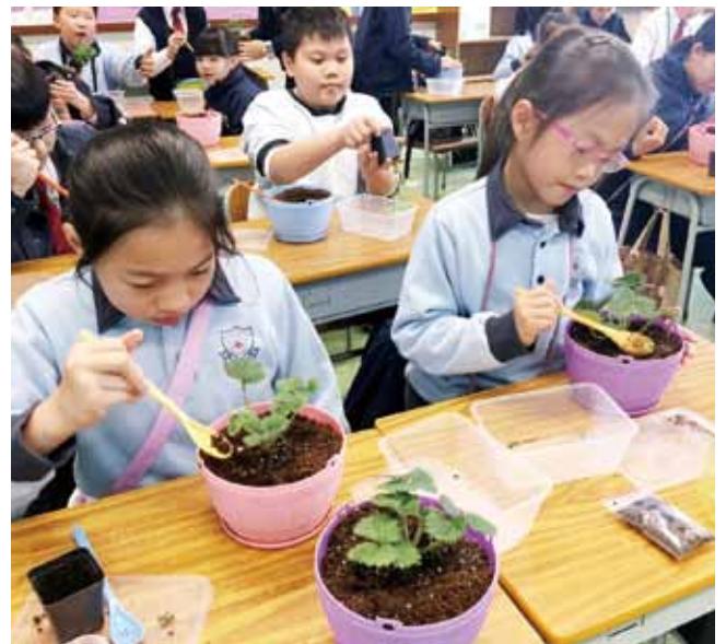
蔡小推廣「一人一花」活動，學生悉心栽培屬於自己的植物

在計劃初段，教師會帶領「資訊科技小領袖」到研習徑的不同生態項目作初步探究，著小領袖就有興趣的主題作深入研習，並將研習成果以生態日誌及資訊專頁形式上載至互聯網，以及透過研習徑內設置的二維碼(QR Code)標籤讓師生和社區人士利用移動裝置掃描標籤，讀取有關網頁的多媒體資訊。