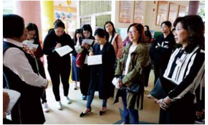
佛山市禪城區機關第一幼兒園代表細心介紹該園的安全管理措施

2016/17學年，仁濟醫院12間院屬幼稚園/幼兒中心以「校園安全」為聯校教師專業發展的主題。繼2016年11月26日舉行教育研討會及分層培訓工作坊後，一行逾百名幼稚園校長、教師於2017年3月31日前往佛山市進行兩天一夜的「教師專業交流2017」活動，到訪具衛生防疫安全、食物安全、環境建設安全等相關認證的學校，並與當地幼兒教育工作者互相觀摩和交流。