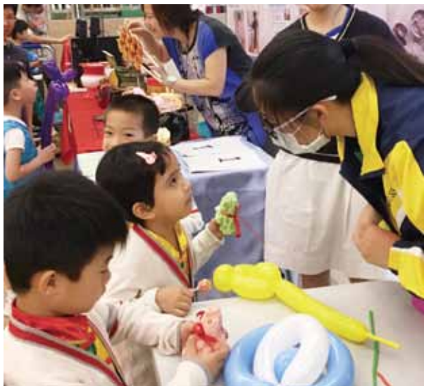
幼兒開心地拿著哥哥姐姐送上的熊仔毛巾

上述活動是仁濟董事局金禧慶祝活動之一，更是香港特區政府賀回歸20周年的認可慶祝活動，並獲華人廟宇委員會之華人慈善基金贊助。