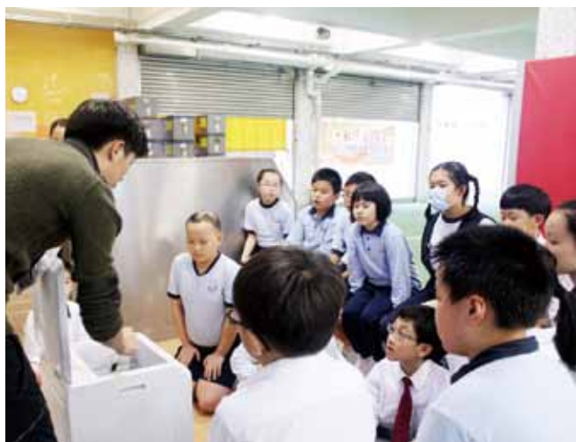
學生學習使用廚餘機，珍惜食物不浪費