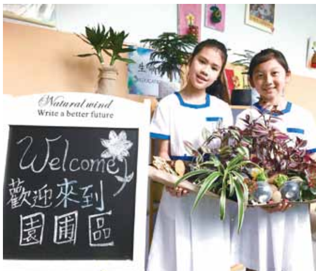
蔡小學生花心思廢物再造，創作不平凡的藝術品