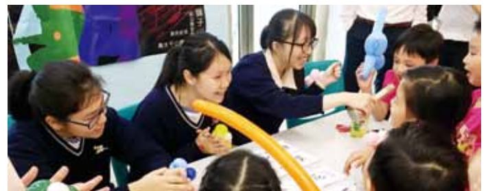
仁濟院屬中學生教幼兒唱懷舊金曲，樂也融融！