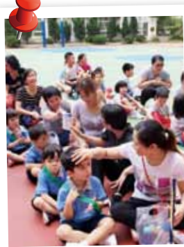
孩子累了，媽媽呵護備至