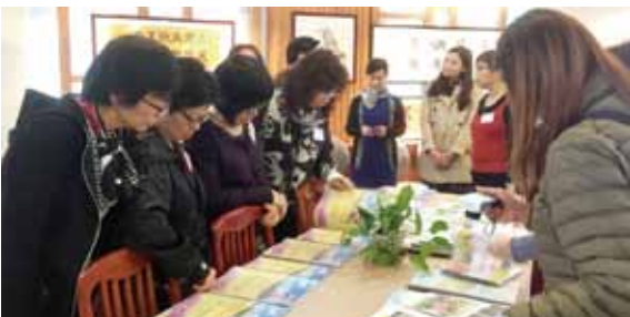
仁濟幼稚園校長細看佛山市惠景幼兒園的安全檔案資料，觀摩學習