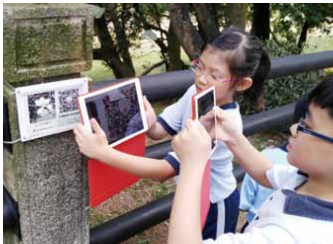
學生輕輕鬆鬆，在數碼生態研習徑也能隨時學習